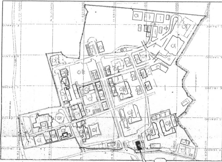
PLANO DE LOCALIZACIÓN Esc: 1:15000